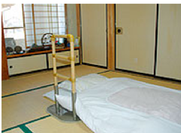
使用例 布団からの立ち上がり