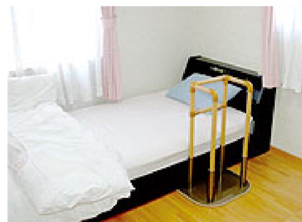
使用例 ベッドからの立ち上がり